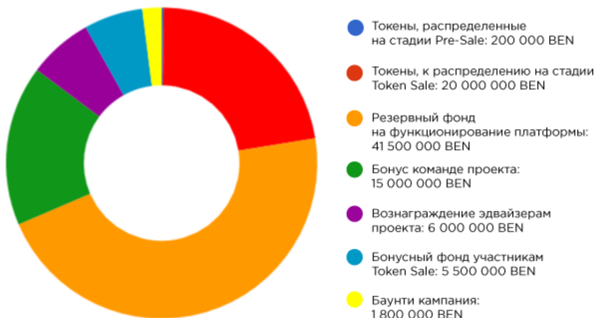
Распределение токенов Bitcoen